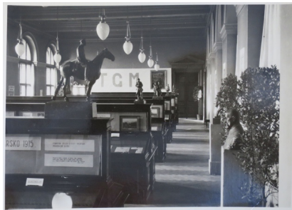
Obr. 3 a 4: Pohľad do výstavy T. G. Masaryk a zahraniční krajané v našej odboji (1937).