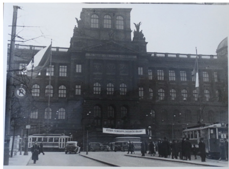
Obr. 5 a 6: Výstava T. G. Masaryk a zahraniční krajané v našej odboji (1937) v budove Národného múzea v Prahe.