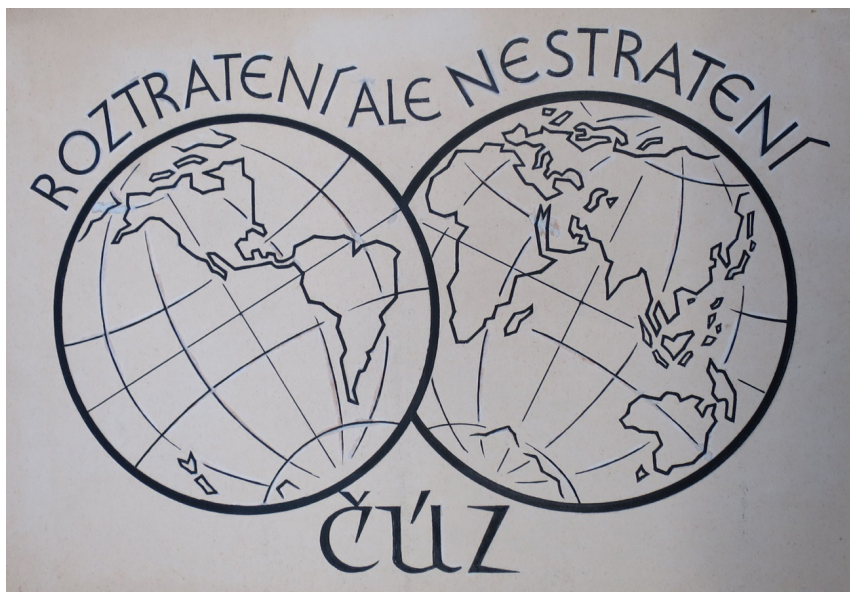
Obr. 1: Logo Československého ústavu zahraničného z roku 1928.