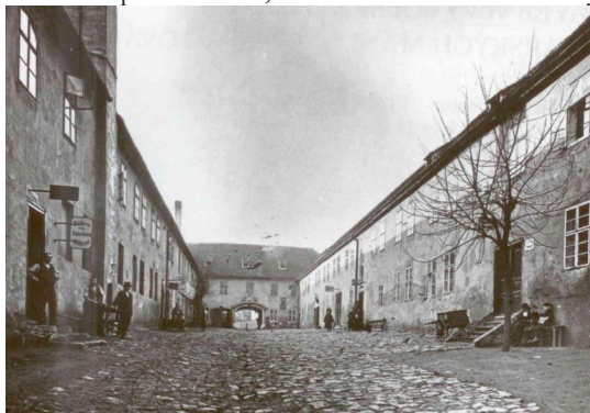
Obr. č. 2: Pohled do 2. Dvora manufaktury před rokem 1900

Největší význam Köffillerovy (a později Schmallovy) manufaktury tví v tom, že „vychovala“ velkou řadu mistrů svého oboru, dělníků, kteří následně přešli do nových provozů a především samotné podnikatele, kteří se osamostatnili a vybudovali své prosperující podniky.