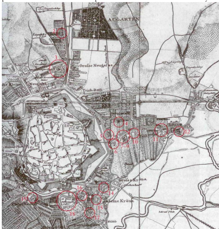
Obr. č. 1: Plán města Brna z roku 1815 s vyznačením textilních manufaktur.

V zahraničí jsou již mnoho let realizovány úspěšné projekty transformace brownfieldů. Ráda bych na tomto místě upozornila například na finské město Tampere, které bylo rovněž centrem textilního průmyslu, i když v menší míře, než tomu bylo v Brně. Místní textilní továrna z roku 1880, která byla v provozu do 70. let 20. století, byla přetransformována do muzejního a kulturního centra. Jedná se o areál velikosti 115 000 m 2 a dlouhodobý projekt jeho přestavby byl zahájen v roce 1988 18 . Kulturní centrum bylo veřejnosti otevřeno v roce 1996, muzeum pak v roce 2000. Kromě expozice o historii místní textilní výroby se zde nachází přírodovědné