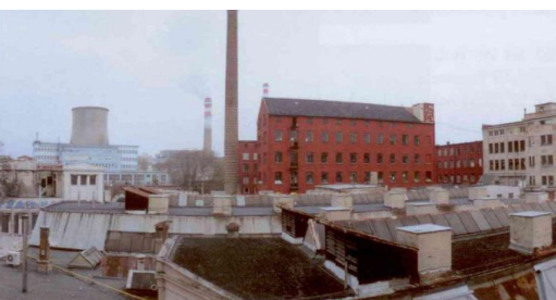
Obr. č. 5: Továrny na vlněné zboží D. Hecht a Hlawatsch & Isbary / Sdružené továrny na vlněné zboží, stav v roce 2014.