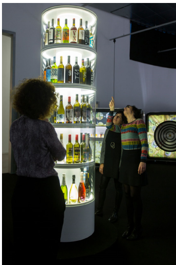
Obr. č. 3.

bohatý program včetně dalších menších instalací (např. „Dishes of the Day“) a také k ní byl vydán katalog.