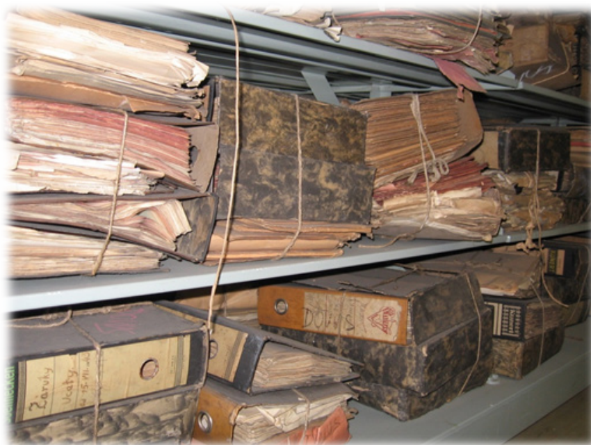
Obr. č. 2: Ukážka nesprístupnených archívnych fondov.

Navrhovaný postup, teda najskôr roztriediť všetky dokumenty hospodárskeho charakteru z prvej polovice 20. storočia na samostatné fondy a až potom pokračovať ich usporiadaním a inventarizovaním, pokladáme za najvhodnejší spôsob, ako sa dá predísť situáciám, keď ku sprístupnenému archívnemu fondu musí pribudnúť množstvo dodatkov, ktoré svojim rozsahom niekedy prevýšia aj pôvodný archívny fond. Veríme, že aj keď takýto dnes už nie úplne štandardný postup pri sprístupňovaní archívnych fondov v blízkej dobe prinesie bádateľom skôr menej spracovaných archívnych fondov, v dlhšom časovom horizonte ich počet bude rovnaký a kvalita oveľa vyššia.